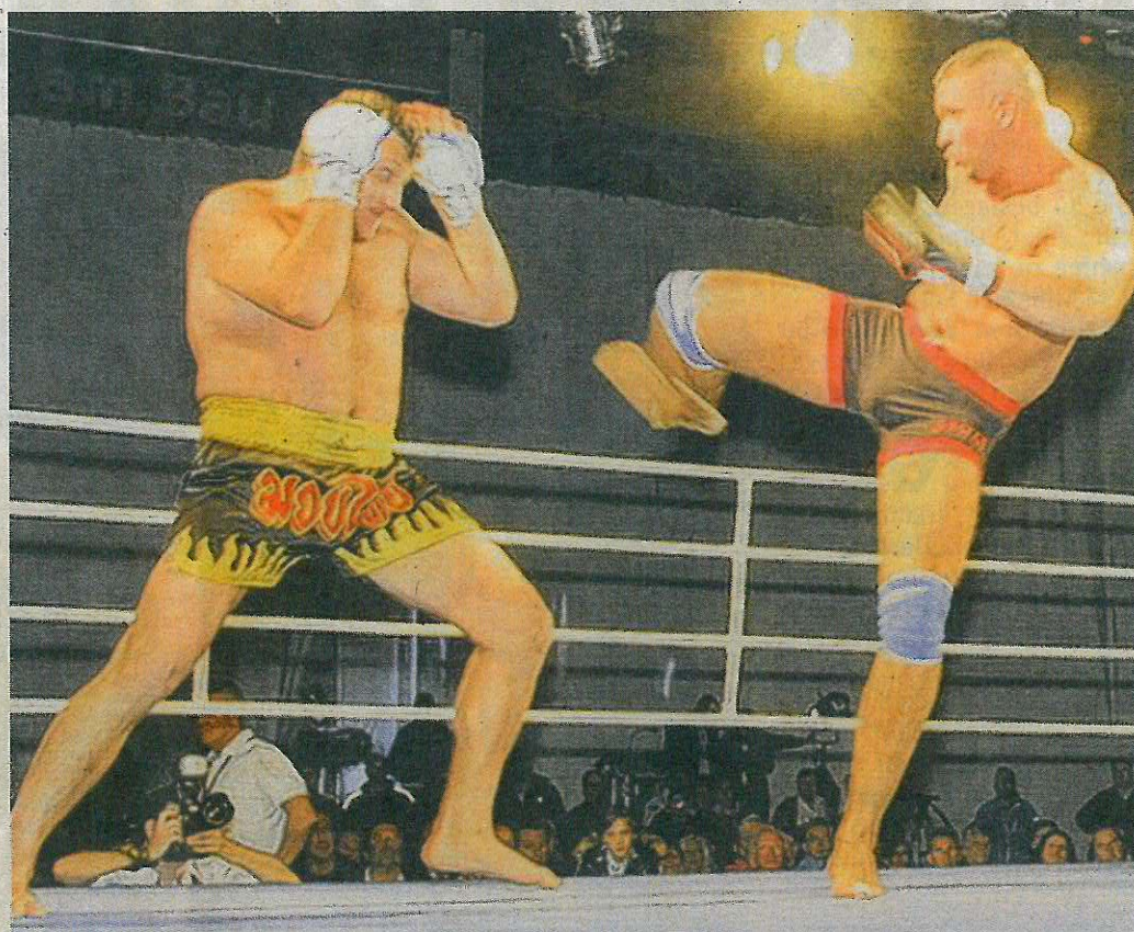
Mächtig zur Sache ging es bei der „Fight of the Night“ in der Mercedes Benz-Arena in Kitzbühel.